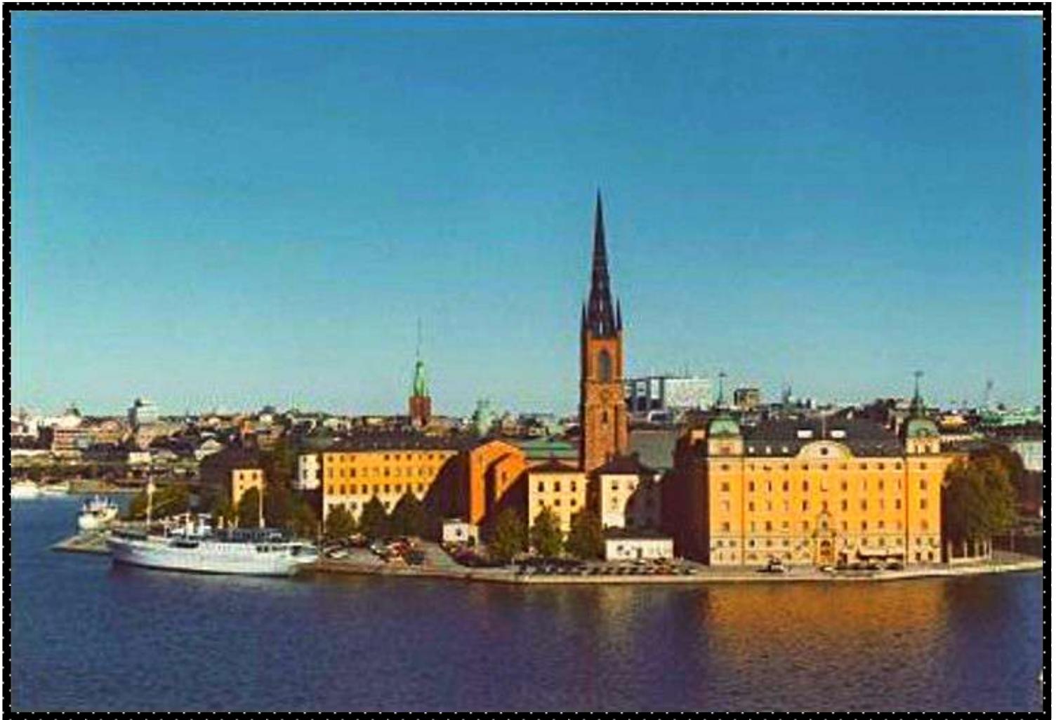
Utsikt från Mariahissen över Riddarholmen.